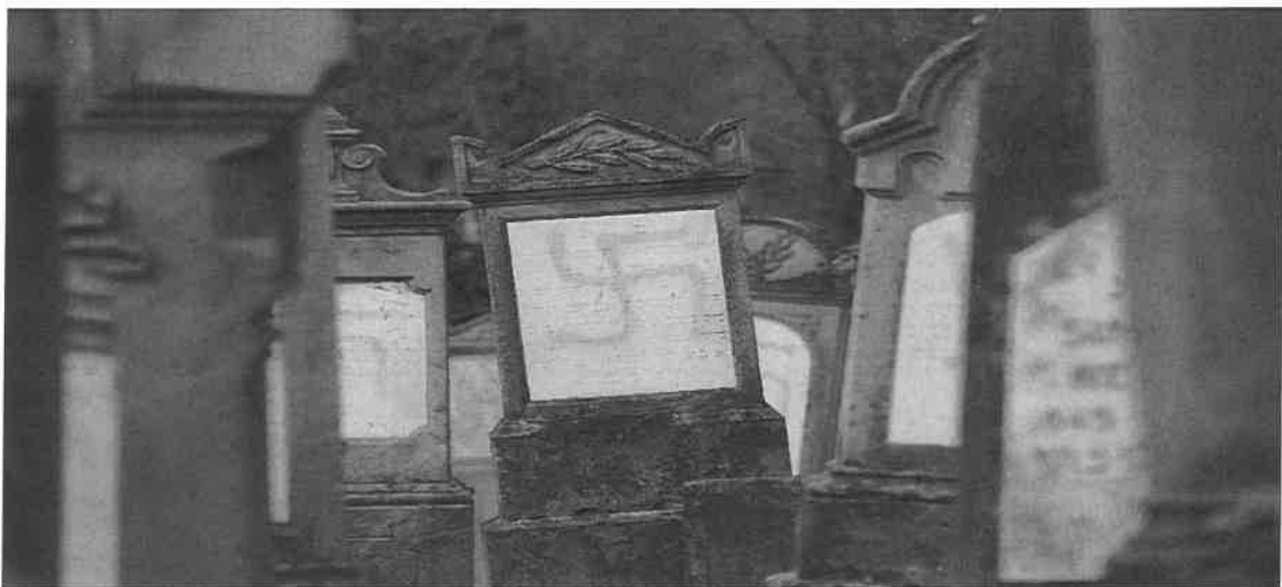
<p>Februari 2019. Met hakenkruisen beschilderde graven op de <span class="keyword">joodse begraafplaats</span> van Quatzenheim, in het noordoosten van Frankrijk. <span class="credit">afp</span></p>

Het principe never forget , de opdracht om de Holocaust niet in de vergetelheid te laten verzinken, hangt samen met het beginsel never again : die tragedie mag zich nooit meer herhalen. Die visie geniet een brede officiële en politieke steun, onder meer via de Verklaring van Stockholm (2000) en haar institutionele verlengstuk, de International Holocaust Remembrance Alliance, waar ook België zich bij aansloot en die geaffilieerd is met de VN.